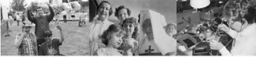
Making a Difference Every Day - Then and Now